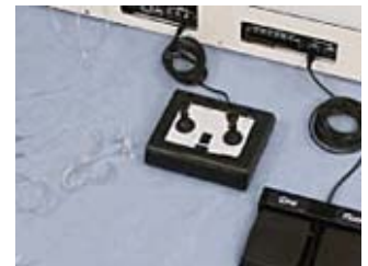
シリンジ/マニホールド

実際の機器操作と同様の環境を再現して、フットペダル(シネ・キャプチャやフルオロスコープを制御)、ジョイスティック(Cアームとテーブルを制御)、キーボード(モニター上の選択)を、訓練者は操作します。