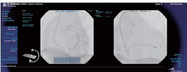
心不全 (HF) 治療トレーニング／徐脈治療トレーニング