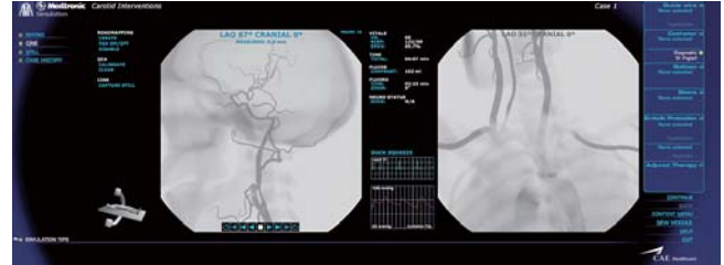
頸動脈インターベンショントレーニング