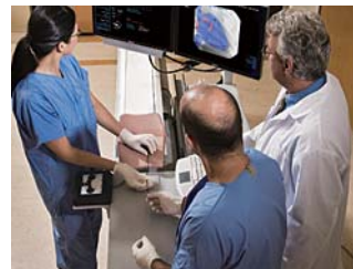
ユーザー・インターフェース

1台はフルオロスコープ画像の他、バーチャル・アシスタント機能、ナビゲーション・コントロール、患者情報を表示します。もう1台はフジジョ/シネ/スチル画像を映し、さらにCアームのコントロール、処置開始からの経過時間、フルオロスコープおよびシネの照射時間、造影剤投与量を表示します。