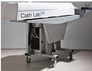
専用カート(電動高さ調整機能有り)

専用カートはキャスター付きで容易に移動できます。専用カートのシェルフ上に、キャスラボ・ブイアール本体が設置されています。コンピューター内蔵の本体ユニットには、患者の身体部位に似せたアナトミカル・プレート他、訓練者による機器操作の信号を取り込むポート各種端子が付いています。